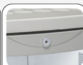
Serratura di serie