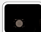
Ventilatore interno di assistenza